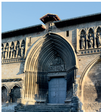
Kościół Santo Sepulcro

Estella to miasto o bogatej historii i dużym znaczeniu dla Camino de Santiago. Było ważnym ośrodkiem handlu oraz punktem obsługi ruchu pielgrzymkowego. Podobnie jak niegdyś w Pampelunie, sąsiadowały tu ze sobą oddzielone murami gminy zamieszkiwane przez różne społeczności: Nawarryczyków, Franków i Żydów. Bezpieczeństwa strzegły rozlokowane na otaczających Estellę wzgórzach zamki-warownie – niestety, nie zachowały się. W miasteczku przetrwało kilka średniowiecznych świątyń o dużych walorach artystycznych. Pierwsza – to stojący u wejścia do historycznej części miasta, zamknięty od końca XIX wieku kościół Santo Sepulcro. Został zbudowany przez bogatych kupców frankijskich w stylu przejściowym między romanizmem a gotyką i służył jako miejsce pogrzebowe. Ikonografia imponującego portalu przedstawia historię pasyjną – począwszy od Ostatniej Wieczery po Zstąpienie Chrystusa do piekiel . Ponadto w dwunastu wnękach (po sześć z każdej strony portalu) umieszczono rzeźby świętych. Wejścia do świątyni strzegą św. Jakub i św. Marcin z Tours. Tego pierwszego rozpoznamy oczywiście po muszli.