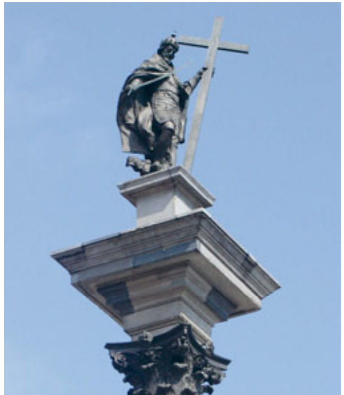
Kolumna Zygmunta przed Zamkiem Królewskim w Warszawie