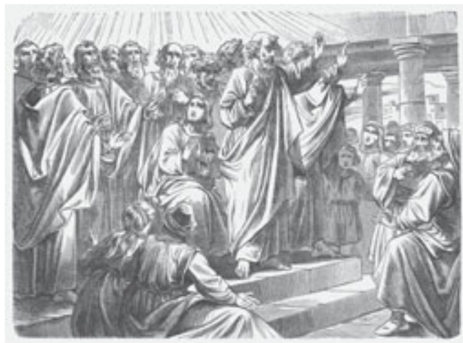
Wystąpienie św. Piotra w dniu Zesłania Ducha Świętego

wiecznej radości. Biorąc udział w niedzielnej Eucharystii, stajemy się uczestnikami wydarzeń paschalnych, przez które Chrystus nas zbawia i daje życie wieczne. Świętujemy triumf zmartwychwstania i oczekujemy na powtórne przyjście Chrystusa.