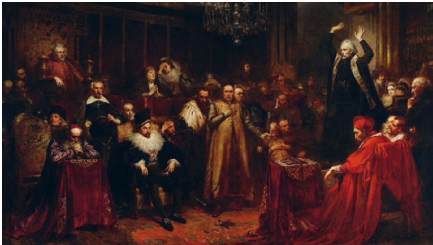
Jan Matejko, Kazanie Skargi (fragment), 1864 Ks. Piotr Skarga SJ (1536-1612) był nadwornym kaznodzieją króla Zygmunta III Wazy. W swoim najslawniejszym dziele, Kazaniach sejmowych , zawarł ocenę sytuacji państwa. Wytykał szlachcie brak miłości ojczyzny i niezgodę, krytykował osłabienie i ograniczenie władzy królewskiej, niesprawiedliwe prawa, bezkarność występków przeciw Kościołowi i duchowieństwu, występował