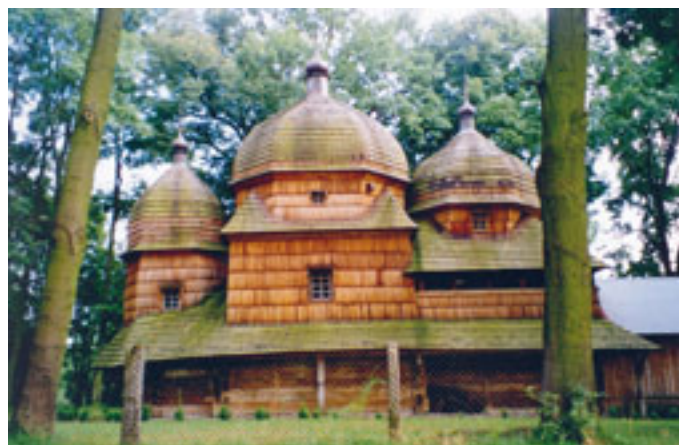
Greckokatolicka cerkiew w Chotyńcu, parafia pw. Narodzenia NMP