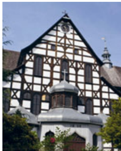
Protestancki Kościół Pokoju w Świdnicy

Niezwykłym wyjątkiem w skali europejskiej były także względne swobody, którymi cieszyły się w ówczesnej Polsce gminy żydowskie, a także wyznawcy islamu.