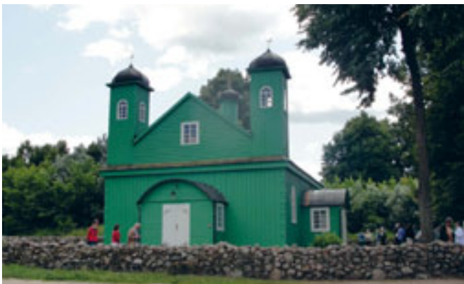
Meczet w Kruszynianach

bł. Jan Paweł II, Przemówienie do przedstawicieli władz państwowych ogłoszone na Zamku Królewskim, 08.06.1987 (fragment)