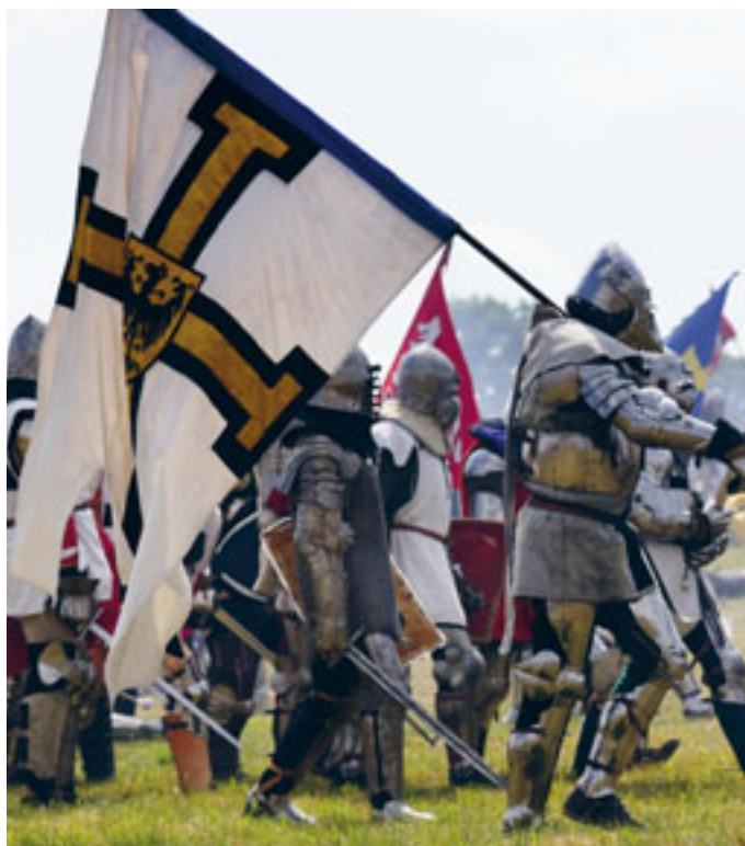
Chorągiew krzyżacka. Rekonstrukcja bitwy pod Grunwaldem