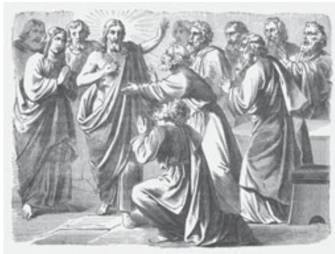
Zmartwychwstały Jezus ukazuje się uczniom

Niedziela nie kończy tygodnia, ale rozpoczyna nowy. Jest to nawiązanie do nowego człowieka, jakim każdy z nas stał się przez chrzest i Eucharystię. To nowy początek, który jest zapowiedzią