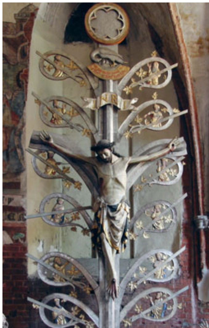
Drzewo Życia, gotycka rzeźba z kościoła pw. św. Jakuba, Toruń

W ciągu IV wieku krzyż z symbolu haniebnej, przeklętej śmierci przeistoczył się w znak zwycięstwa. Zaczął odgrywać ważną rolę w życiu chrześcijan. Stał się znakiem pożądanym przez wszystkich: władców i ich poddanych, żony i mężów, niewolników i wolnych. Wierni nosili go na piersiach. Znakiem krzyża zdobiono komnaty, ubrania, broń, naczynia. Wznoszono krzyże na dachach domów, stawiano przy drogach. Krzyż towarzyszył wiernym zawsze, w dzień i w nocy, w czasie wojny i pokoju, podczas festynów i biesiad, a przede wszystkim przy uprawianiu ascezy. Znakiem krzyża leczono chorych i wypędzano demony.