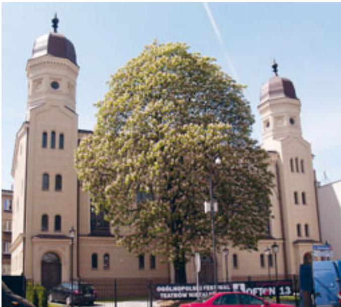
Budynek dawnej synagogi w Ostrowie Wielkopolskim