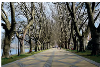
Droga przed Ponte de Lima

Z szosy dość szybko schodzimy w lewo na boczne wijące się dróżki, idziemy przez wioski Anta, Paço oraz Barros. Po 3,7 km przechodzimy przez most oraz obok kaplicy Nossa Senhora Das Neves . Następnie dochodzimy do rzeki Lima i idziemy wzdłuż niej. W zasięgu wzroku mamy nowy most, a za nim zabytkowy rzymsko-średniowieczny, co wskazuje, że jesteśmy blisko celu. Do centrum i zabytkowego mostu zbliżamy się mijając kościół Nossa Senhora da Guia , a następnie dawny kościół zamieniony w muzeum dos Terceiros .