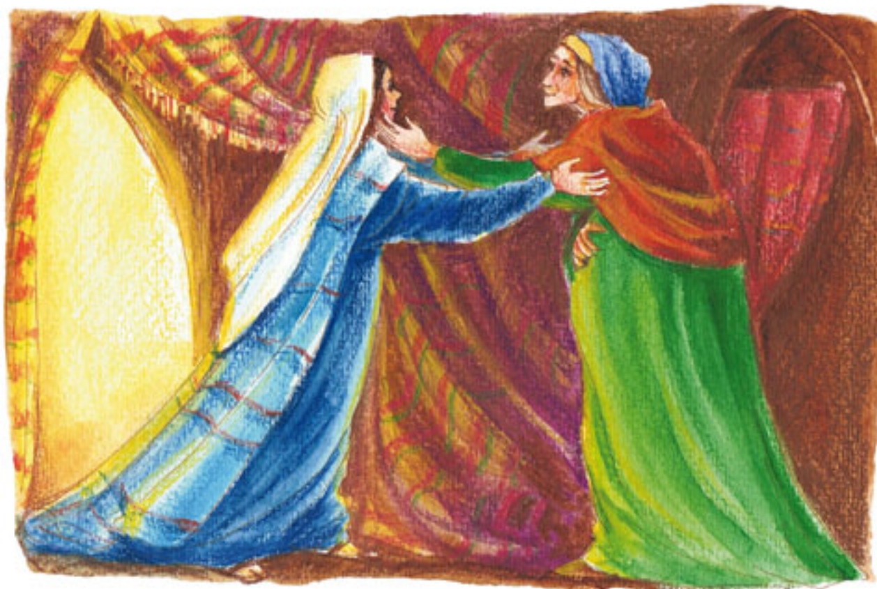
Spotkanie Matki Bożej ze świętą Elżbietą nazywamy Nawiedzeniem Najświętszej Maryi Panny.

Kiedy Archanioł Gabriel zwiastował Maryi, że urodzi Zbawiciela, powiedział Jej też, że Elżbieta, mimo podeszłego wieku niedługo urodzi dziecko. Była to tak radosna wieść, że Matka Boża wkrótce wyruszyła do swojej krewnej. Chciała ją odwiedzić i pomóc jej w domu. Idąc pieszo przez góry, Maryja musiała pokonać wiele trudów i niebezpieczeństw. Jednak nie myślała o swojej niewygodzie, lecz o Elżbiecie i ich wspólnej radości. Niosła w sobie małego Jezusa, o którym jeszcze nikt oprócz Niej i Pana Boga nie wiedział.